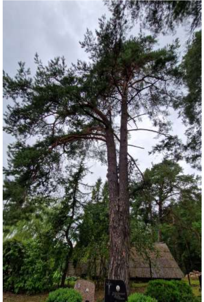
Nr. 3 Nepavojinga, pakankamai sveika