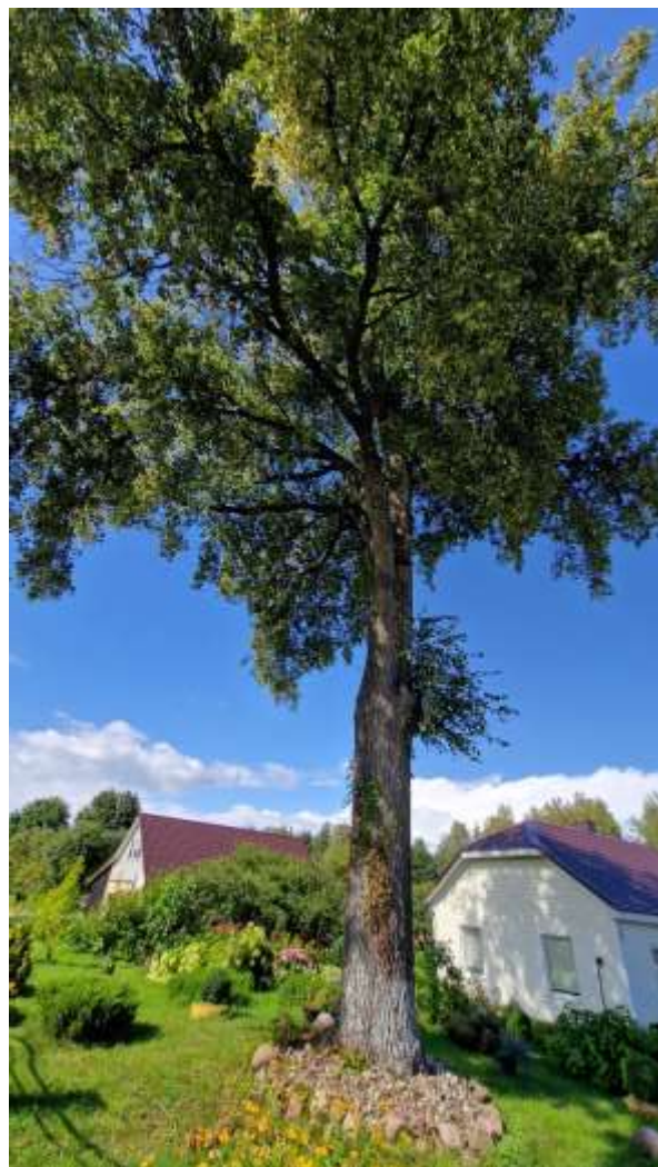
Nr. 6 Nepavojinga