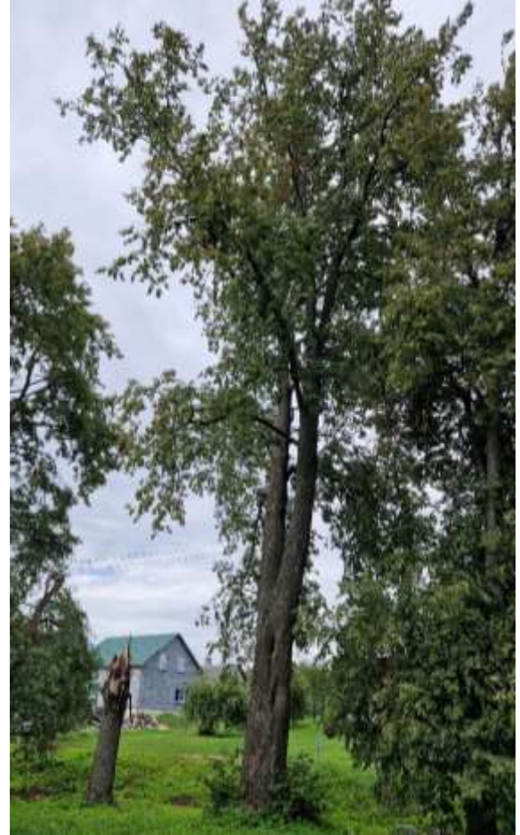
Nr. 7 liemuo išpuvęs, drevės gilios, greta - lūžusi liepa. Pavojinga dėl išlūžimo