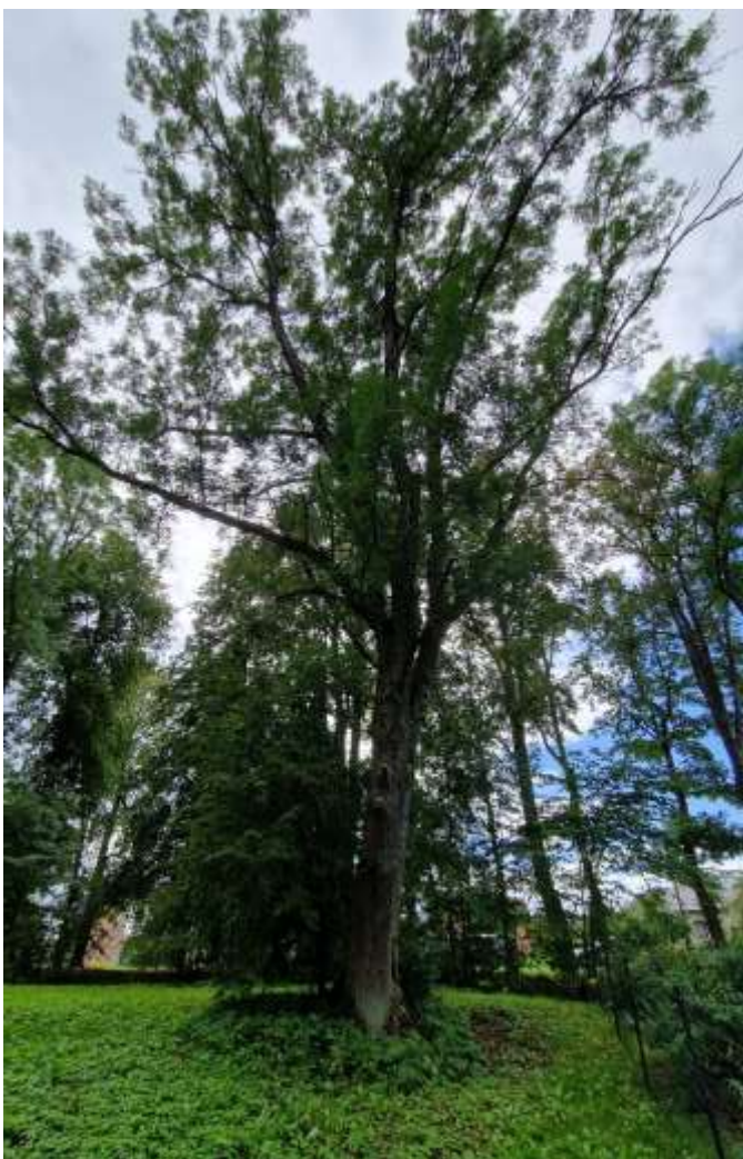
Nr. 4,5 dvikamienis, pavojingas dėl išvirtimo