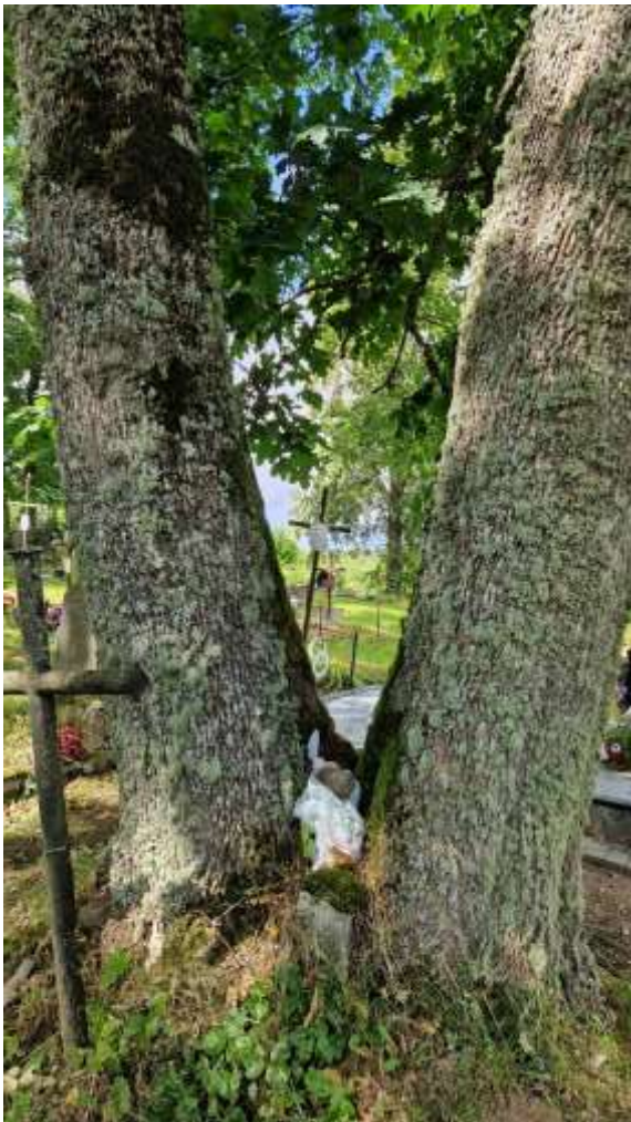
Nr. 1, 2 – pakankamai sveiki