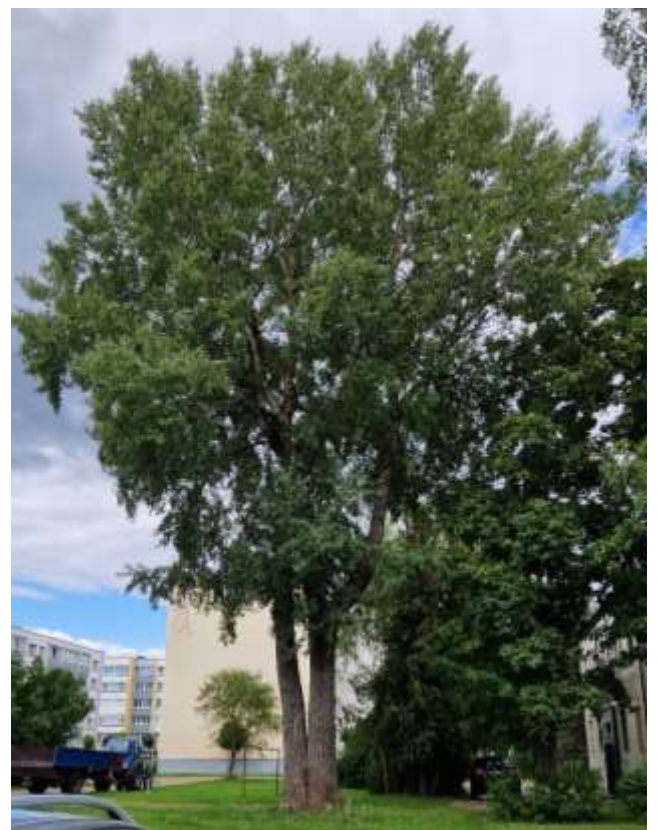
Nr. 8 tuopos kiauras liemuo dėl puvinio, medis pavoingas