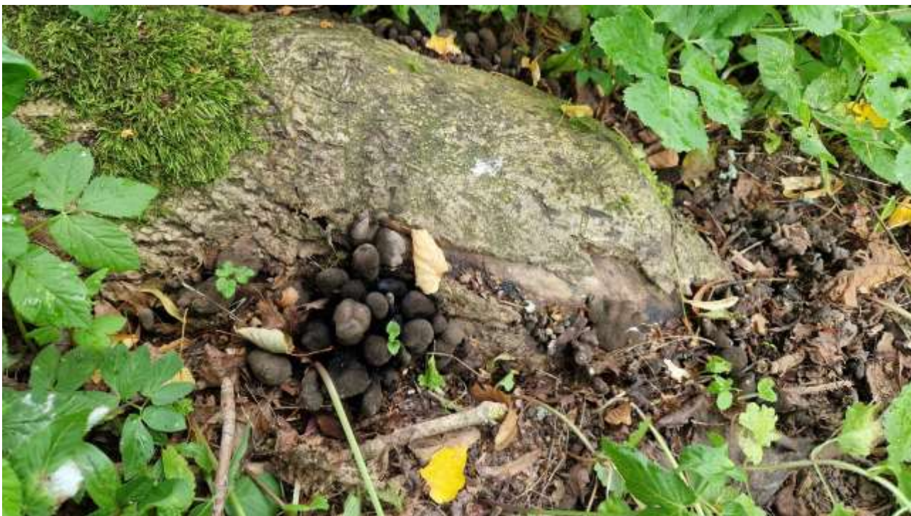
Nr. 4,5 – šaknų puviniai