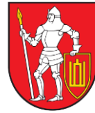
Trakų rajono savivaldybė