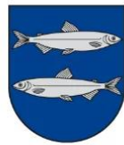
Švenčionių rajono savivaldybė