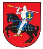
Vilniaus rajono savivaldybė