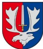
Širvintų rajono savivaldybė