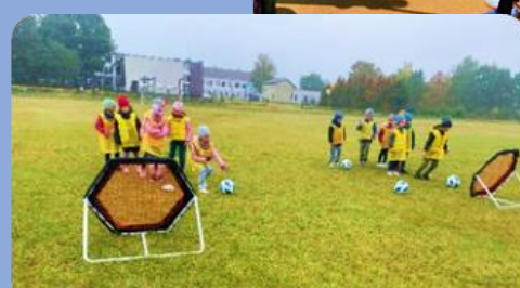
Futbolo treniruotės / užsiėmimai ikimokyklinio amžiaus vaikams (amžius 4–7 metai) bei draugiškos futbolo varžybos tarp ikimokyklinio amžiaus vaikų