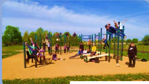
Mokymai / paskaitos vaikams