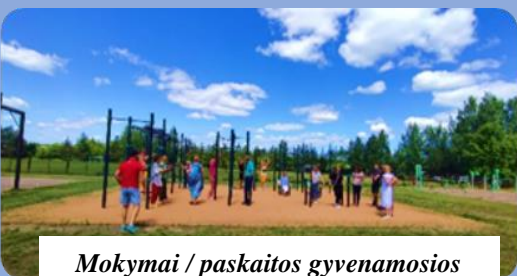
Mokymai / paskaitos gyvenamosios vietovės bendruomenei