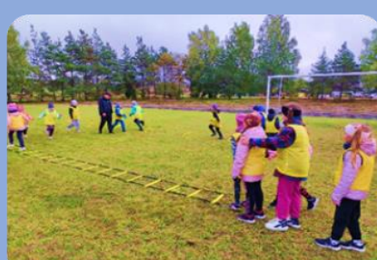
Futbolo treniruotės / užsiėmimai vaikams (amžius 6–10 metų) bei draugiškos futbolo varžybos tarp pradinėjų klasių mokinių