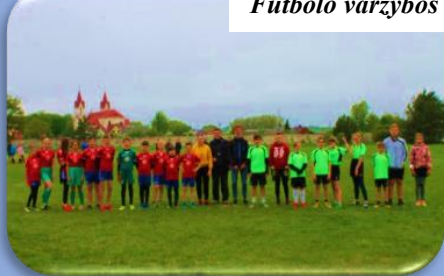
Futbolo varžybos tarp mokyklų